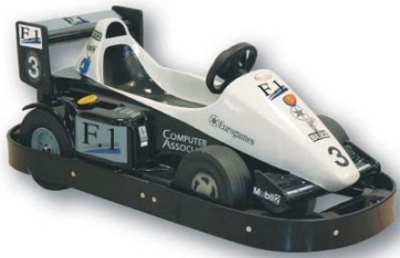
Formel 1 Basic EC-01-03-016-00