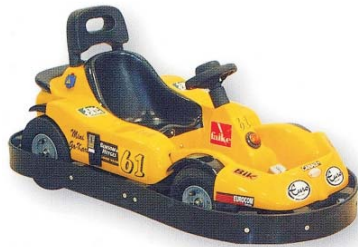
Mini Go Kart Single EC-01-03-005-00