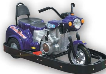
Moto Chopper EC-01-03-019-00