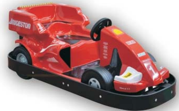
Formel 1 V-Max EC-01-03-018-00