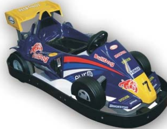
Formel 1 V-Power EC-01-03-017-00