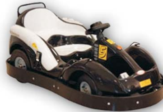
Mini Go Kart Twin EC-01-03-002-00