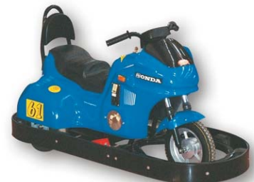
Moto Sporting EC-01-03-020-00