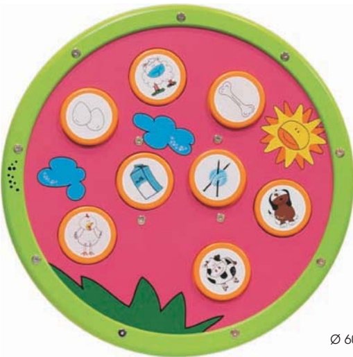
Ø 60 cm, T 6 cm

Durch Drehen des Rads fließt der Sand durch das Sieb und legt langsam die darin liegenden Schätze frei.