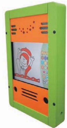
B 45 x H 70 x T 9 cm