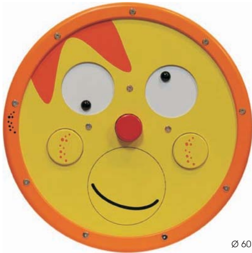
Ø 60 cm, T 6 cm