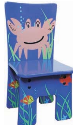
B 32 x H 64 x T 28 cm