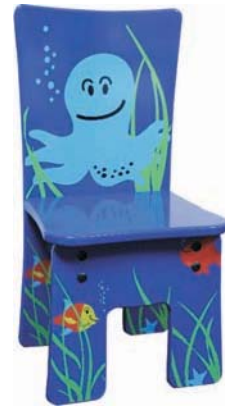
B 32 x H 64 x T 28 cm