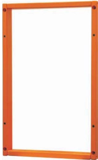
B 45 x H 70 x 6 cm