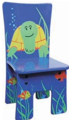
B 32 x H 64 x T 28 cm