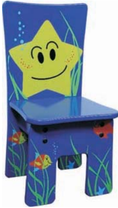
B 32 x H 64 x T 28 cm