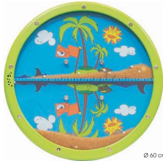
Ø 60 cm, T 6 cm

Das Happy Feeling-Gesicht kann traurig, glücklich und albern sein sowie auf dem Kopf stehen. Durch das Drehen an der Nase können sich die Kinder ihren eigenen Gesichtsausdruck gestalten.