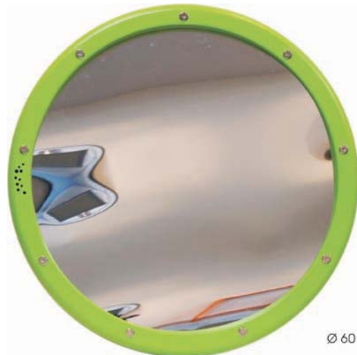
Ø 60 cm, T 6 cm

Durch das Drücken der Knöpfe lehrt dieses Spiel den Kindern die Zusammenhänge zwischen zwei Dingen. Drücke das Schaf und der Knopf mit der Wolle kommt zum Vorschein, drücke den Knopf mit den Eiern und das Huhn tritt hervor und umgekehrt.