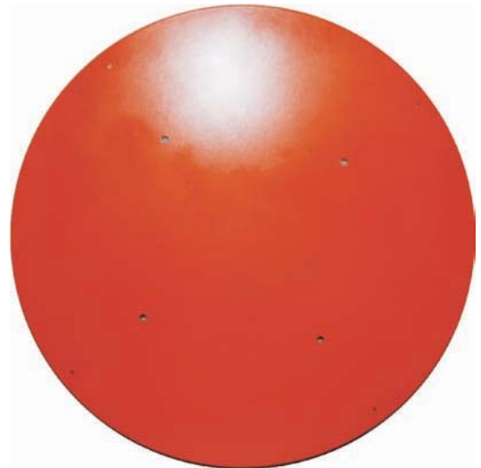
Ø 64 cm, T 1 cm

Die Wallplate ist erforderlich wenn das PlayWheel direkt an der Wand befestigt werden soll.